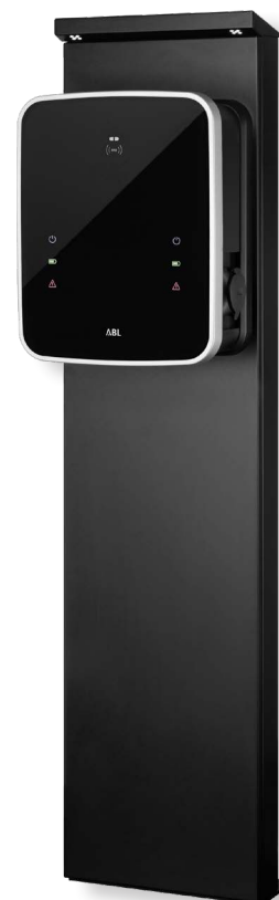
Levering zonder apart verkrijgbare wallbox eMH3

De zuil STEMH30 wordt gebruikt voor de montage van alle eMH3 wallboxen van ABL buitenshuis. De STEMH30 overtuigt door zijn aantrekkelijke en compacte metalen behuizing met behuizingsdeur aan de achterkant om de inbouwcomponenten te beveiligen. Dankzij de in het hoofddeel geïntegreerde leds met schemeringssensor wordt de wallbox voldoende verlicht, ook bij moeilijke lichtomstandigheden: Het wordt aanbevolen om een geschikte verzekering (2 A, 1-polig, C-karakteristiek) voor de geïntegreerde netadapter in te bouwen. Voor een stabiele stand adviseert ABL om de STEMH30 op het optioneel verkrijgbare betonfundament EMH9999 te monteren.