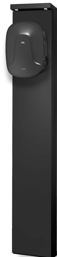
Levering zonder apart verkrijgbare wallbox eMH2

De zuil STEMH20 wordt gebruikt voor de buitenmontage van alle eMH2 wallboxen van ABL. De STEMH20 overtuigt door zijn aantrekkelijke en compacte metalen behuizing met behuizingsdeur aan de achterkant om de inbouwcomponenten te beveiligen. Dankzij de in het hoofddeel geïntegreerde leds met schemeringssensor wordt de wallbox voldoende verlicht, ook bij moeilijke lichtomstandigheden. Voor een stabiele stand adviseert ABL om de STEMH20 op het optioneel verkrijgbare betonfundament EMH9999 te monteren.