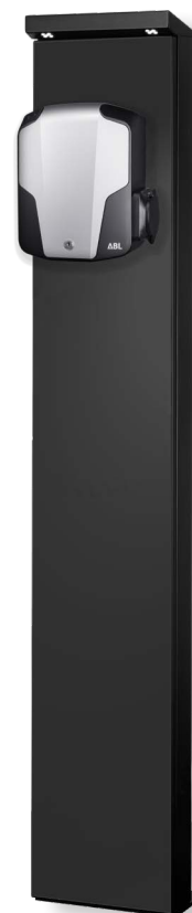
Levering zonder apart verkrijgbare wallbox eMH1

De zuil STEMH10 wordt gebruikt voor de buitenmontage van alle eMH1 wallboxen van ABL. De STEMH10 overtuigt door zijn aantrekkelijke en compacte metalen behuizing met behuizingsdeur aan de achterkant om de inbouwcomponenten te beveiligen. Dankzij de in het hoofddeel geïntegreerde leds met schemeringssensor wordt de wallbox voldoende verlicht, ook bij moeilijke lichtomstandigheden. Voor een stabiele stand adviseert ABL om de STEMH10 op het optioneel verkrijgbare betonfundament EMH9999 te monteren.