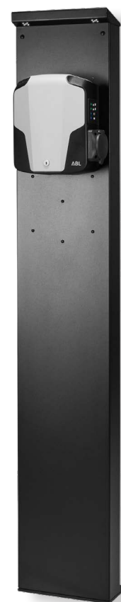
Levering zonder apart verkrijgbare wallbox eMH1

De zuil POLEMH1 wordt gebruikt voor de montage van alle Wallboxen eMH1 van ABL. De POLEMH1 overtuigt door zijn aantrekkelijke en compacte metalen behuizing met behuizingsdeur aan de achterkant om de inbouwcomponenten te beveiligen. Het WPR12 beschuttingsdak en de CABHOLD laadkabelhouder zijn qua kleur op de zuil afgestemd (RAL 9011) zodat harmoniëren met het laadpunt. Dankzij de in het bovendeeel geïntegreerde LEDs met schemeringssensor wordt de wallbox voldoende verlicht, ook bij slechte lichtomstandigheden. Klinkmoeren zijn standaard gezet en afgedekt met blindstoppen, zodat achteraf boren niet nodig is. De stele is voorgeïnstalleerd dankzij de geïntegreerde aansluitklemmen. Voor een stabiele plaatsing adviseert ABL om de zuil op het optioneel verkrijgbare betonfundament EMH9999 te monteren.