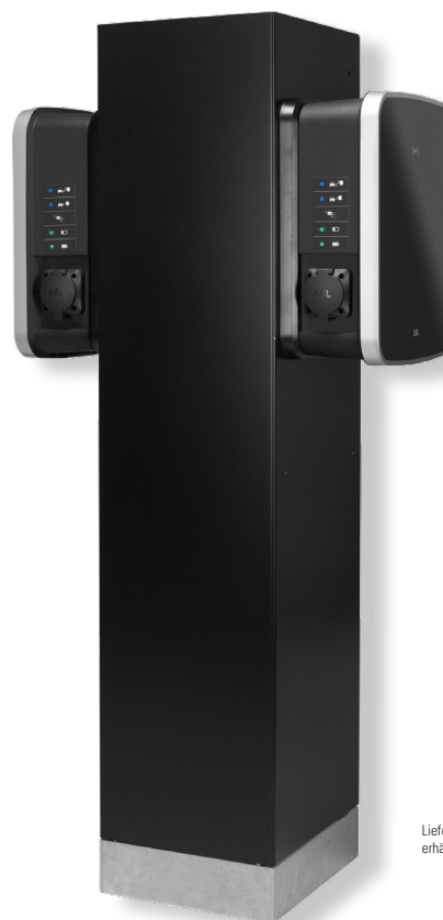
Lieferung ohne separat erhältliche Wallboxen eMH3

Die Stele POLEMH6 dient zur Montage von einer oder zwei Wallboxen eMH3 von ABL. Die POLEMH6 überzeugt durch ihr ansprechendes und kompaktes Metallgehäuse mit Schließzylinder für den kontrollierten Zugriff auf die Einbauten. Zusätzlich zu einer Wallbox eMH3 auf der Vorderseite kann eine zweite Wallbox eMH3 auf der Rückseite montiert und über den internen Kleinverteiler angeschlossen werden. Darüber hinaus bietet der Verteiler genügend Platz für die Montage und den Anschluss einer externen Steuerzentrale 1V0002. Mit dem Wetterschutzdach WPR36 und dem Ladekabelhalter CABHOLD ist die Stele farblich abgestimmt (RAL 9011), womit sie sich harmonisch ins Gesamtbild des Ladepunktes einfügt. Nietmuttern sind standardmäßig gesetzt und mit Blindstopfen abgedeckt, wodurch keine nachträglichen Bohrungen notwendig sind. Für einen stabilen Stand empfiehlt ABL die Montage der Stele auf dem optional erhältlichen Betonfundament EMH9996.